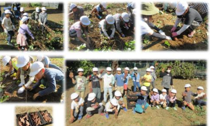
世話をしはげ、きれいなサツマイモが育ちました。熟成させて、長いもちが本当に楽しめます。

11/1 2-1 生活科 さつまいもほり体験 ことり学級では、いち早く収穫したサツマイモを使って、サツマイモチップス作りを行いました。