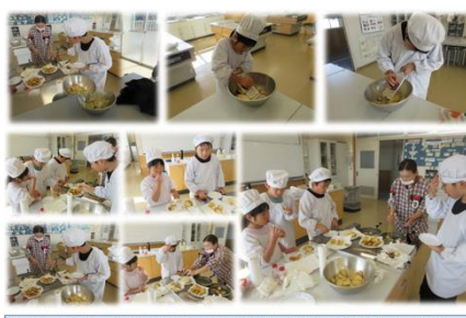
みんなで、育てて、収穫して、美味しく食べる。まさに、本校のふるさと教育ですね。