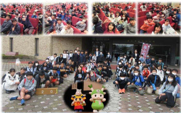
立派な発表で、川本南小のふるさと教育の取組を市内の小中学校に知ってもらえましたね！

みんなで、育てて、収穫して、美味しく食べる。これも川本南小が行っている「ふるさと教育」の一つです。