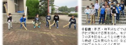
11/5 十日夜 わら鉄砲作りの体験

秋は、収穫の季節です。2年生は、重忠ファームで大きく育ったサツマイモを収穫しました。