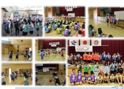
11/2 5-1 親善球技大会

11/21 持久走大会 学校での生活は楽しいことばかりではありません。辛いこと、大変なこともたくさんあります。しかし、その試練に向かって挑戦する勇気と最後までやり遂げようとする覚悟は、スポーツだけではなく、どんな場面でも、大人になっても大切なことだと校長先生は考えます。そして、みなさんががんばっていることもこのクラブからよくわかります。