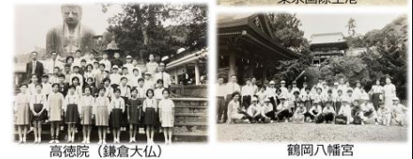
高徳院 (鎌倉大仏) 鶴岡八幡宮

昔も今も、時代は変わっても学校行事の目標は変わりません。 学校行事を通して、友達と協力して活動し、友達のよい所をたくさん見つけて、より良い学校生活を送ることができるようになって欲しいと願っています。