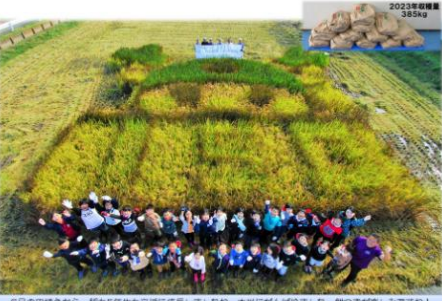
10/2 5-1 田んぼアート 稲刈り④

11月になりました。今月も毎日の生活を楽しみましょう。 10月は天気の日も多く過ごしやすい日々が続きました。そんな中で、いろいろな学習や運動をがんばりました。また、どの学年も学校を離れ、いろいろな場所で挑戦・体験をしました。 10月2日には、5年生が田んぼアートの稲刈りを行いました。今年は385kgのもち米が収穫できました。