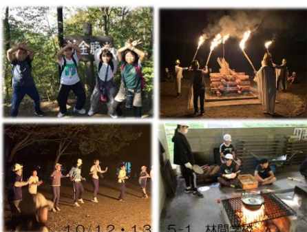
10/12・13 5-1 林間学校

た。12・13日は、5年生が林間学校で小川げんきプラザに行きました。スタンプラリーやキャンプファイヤーなどを楽しみました。