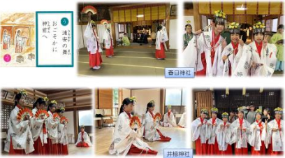
ふるさとを知り、ふるさとを愛し、ふるさとを創る児童の育成 6年生 かわもと郷土かるたの活用 【10月】春日神社・井椋神社 浦安の舞 (10.15)

15日には、春日神社と井椋神社で6年生が浦安の舞を奉納しました。かわもと郷土かるたの通り、とても厳かな舞でした。