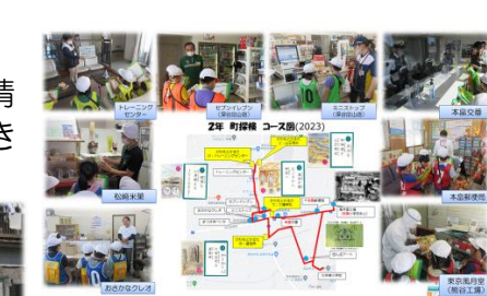
10/17 2-1 生活科 町たんけん③

17日は、2年生が生活科の町探検で、風月堂や松崎米菓などの工場やセブンイレブンやミニストップなどのお店を見学しました。