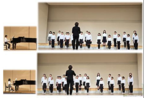
10/24 4-1 市内音楽会②

26日は、3年生が満福寺、重忠公園、ハーズなどを見学しました。重忠公についてたくさん知る