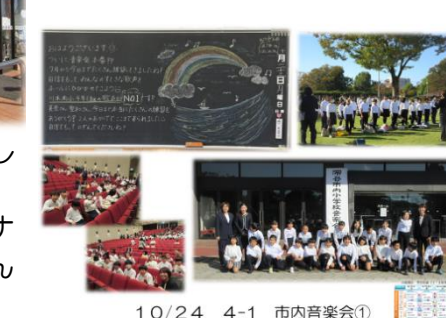
10/24 4-1 市内音楽会①

ませんでした。その4年生が、ステージで全力で声を響かせ歌っている姿は、とても素晴らしく、感動しました。