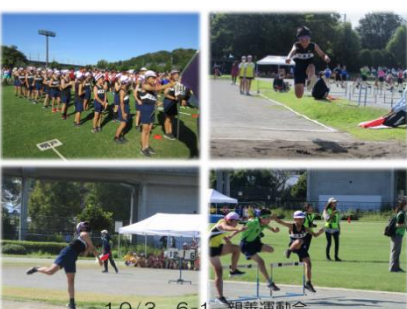
10/3 6-1 親善運動会

3日の深谷市親善運動会では、6年生が、一走懸命、一跳懸命、一投懸命それぞれの種目でがんばりました。