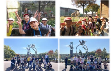
10/27 1-1 生活科校外学習 (こども動物自然公園)

26日は、3年生が満福寺、重忠公園、ハーズなどを見学しました。重忠公についてたくさん知る