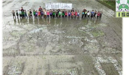
協力はかけ算だ! 5年1組×先生×保護者×応援団=田んぼアート大成功!

そして、6月14日には、応援団・保護者の協力のもと、田植えを行い、見事、伝統の田んぼアートを成功させました。